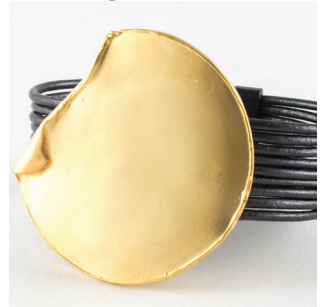
Plaqué Or 22ca