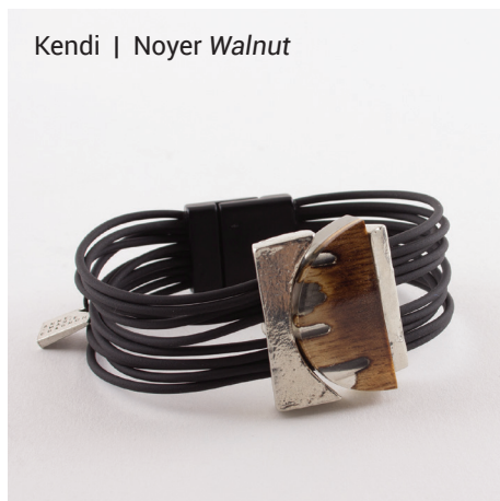
Kendi | Noyer Walnut