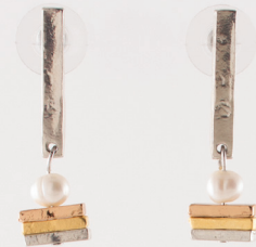
Niobe | Trio