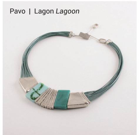
Pavo | Lagon Lagoon