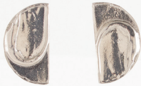
Mico | Étain Pewter