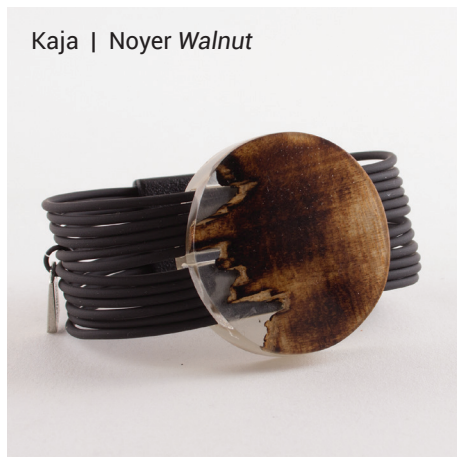
Kaja | Noyer Walnut