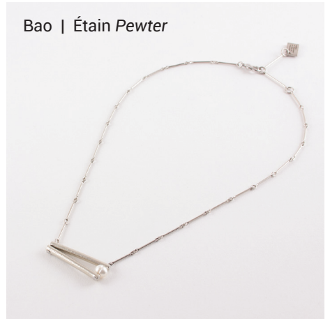
Bao | Étain Pewter