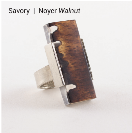
Savory | Noyer Walnut