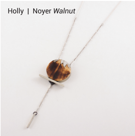
Holly | Noyer Walnut