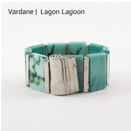
Vardane | Lagon Lagoon