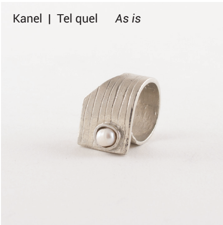
Kanel | Tel quel As is