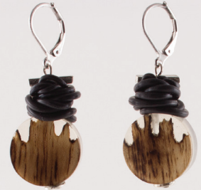
Mau | Noyer Walnut