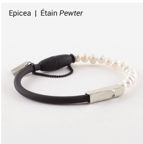
Epicea | Étain Pewter