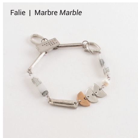
Falie | Marbre Marble