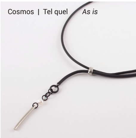
Cosmos | Tel quel As is