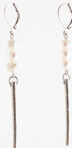
Clemo | Étain Pewter