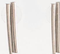
Balsa | Étain Pewter