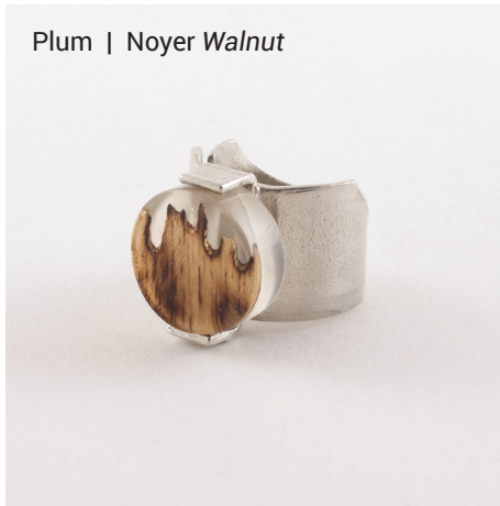
Plum | Noyer Walnut