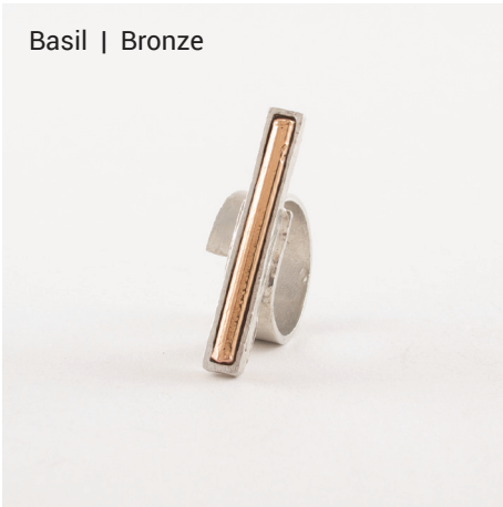
Basil | Bronze