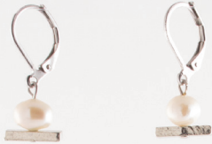
Abelia | Étain Pewter