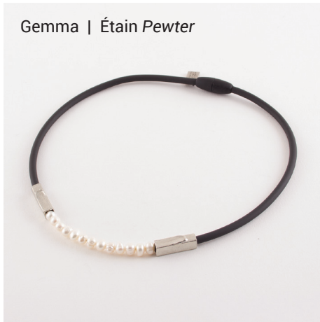
Gemma | Étain Pewter