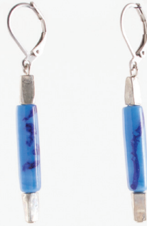
Colza | Azur