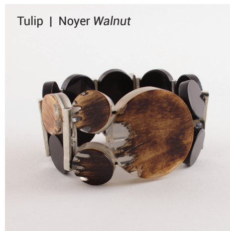
Tulip | Noyer Walnut