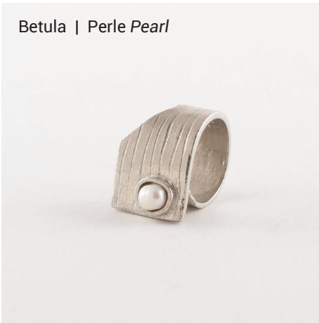
Betula | Perle Pearl