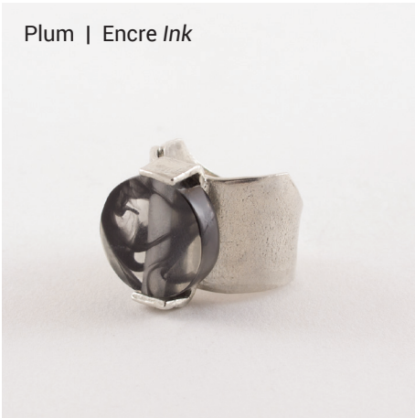
Plum | Encre Ink