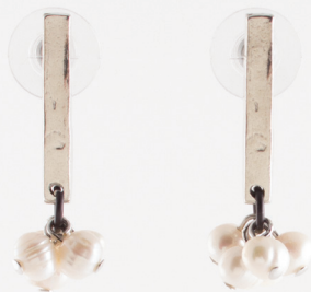
Liane | Perle Pearl