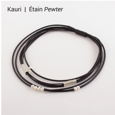
Kauri | Étain Pewter