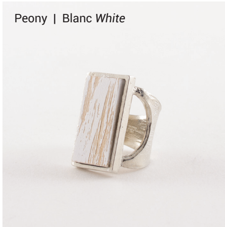
Peony | Blanc White