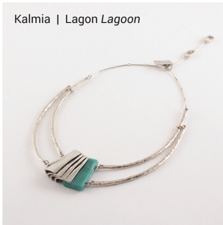
Kalmia | Lagon Lagoon