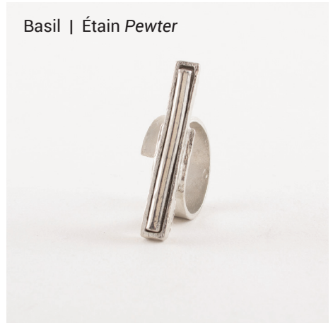
Basil | Étain Pewter