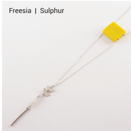
Freesia | Sulphur