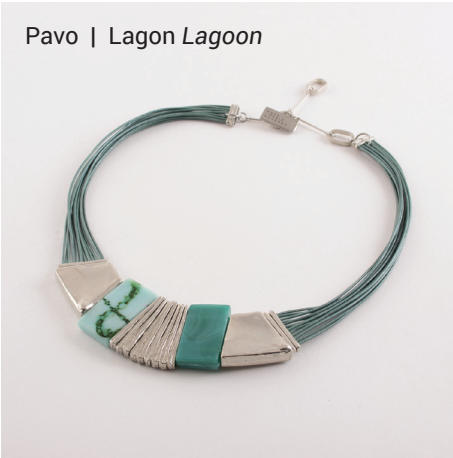
Pavo | Lagon Lagoon