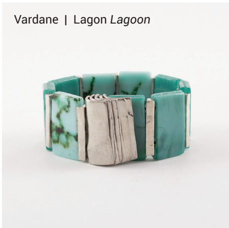
Vardane | Lagon Lagoon