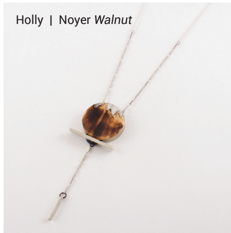
Holly | Noyer Walnut