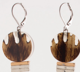
Nemesia | Noyer Walnut