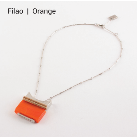
Filao | Orange