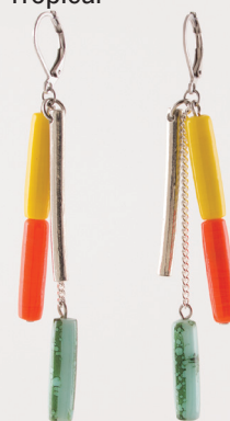
Nymea | Tropical