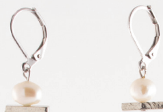
Abelia | Étain Pewter