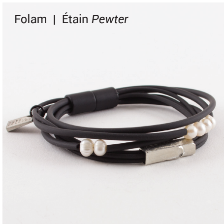
Folam | Étain Pewter