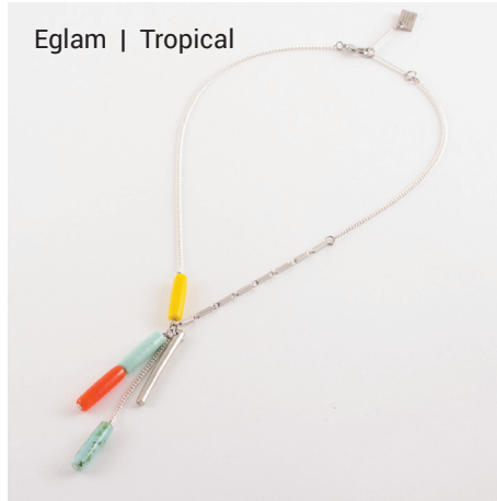
Eglam | Tropical