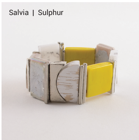
Salvia | Sulphur