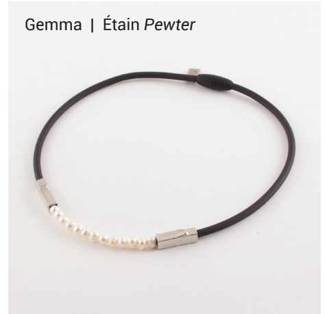
Gemma | Étain Pewter