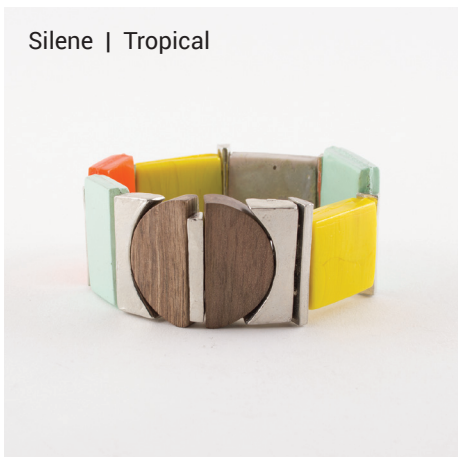
Silene | Tropical