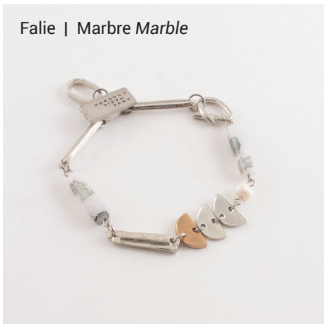
Falie | Marbre Marble