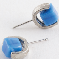
Aveline | Azur