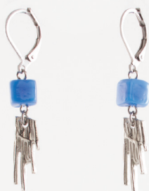
Bilimbi | Azur