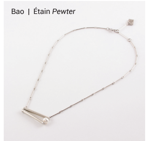
Bao | Étain Pewter