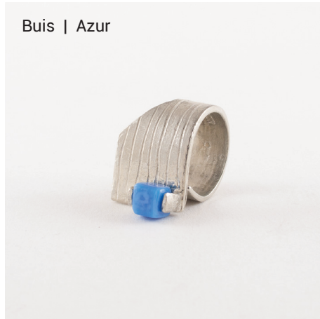
Buis | Azur