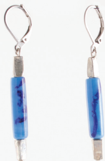
Colza | Azur