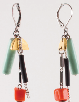
Merisa | Tropical