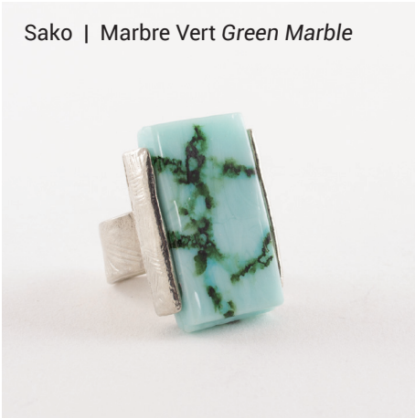
Sako | Marbre Vert Green Marble