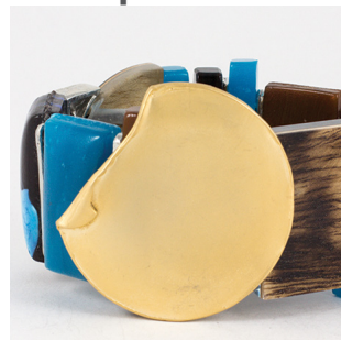
Plaqué Or 22ca